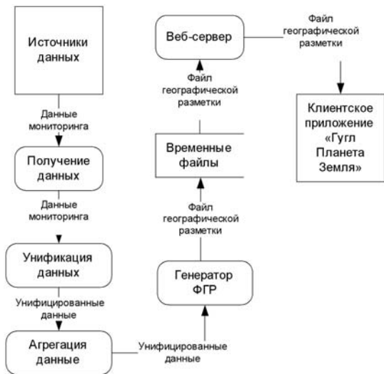
Рис. 1: Диаграмма потоков данных

Диаграмма потоков данных, отображающая потоки между основными функциональными компонентами, показана на рисунке 35.